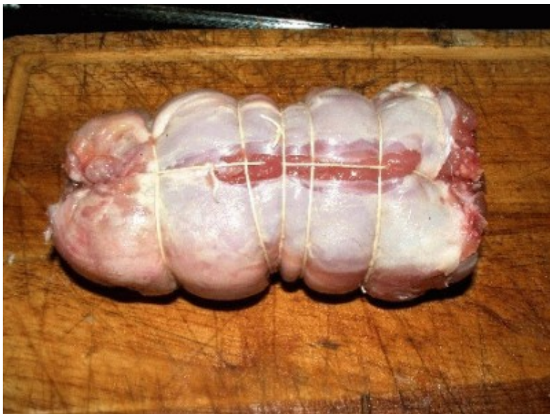
3 Quando la carne si ritira sotto l'azione del calore, chiuderla con le fettine di lardo