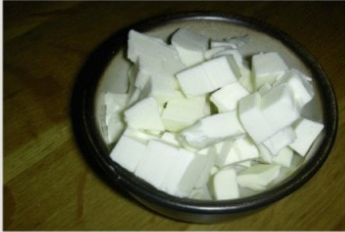
Tagliare il burro freddo a pezzettini