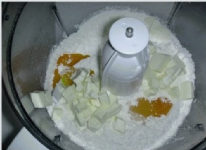
Mettere tutti gli ingredienti nel mixer e versare l'acqua un po' per volta