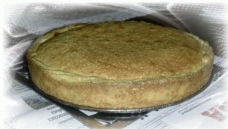
ed eccola dopo 40 min di forno in attesa di essere decorata