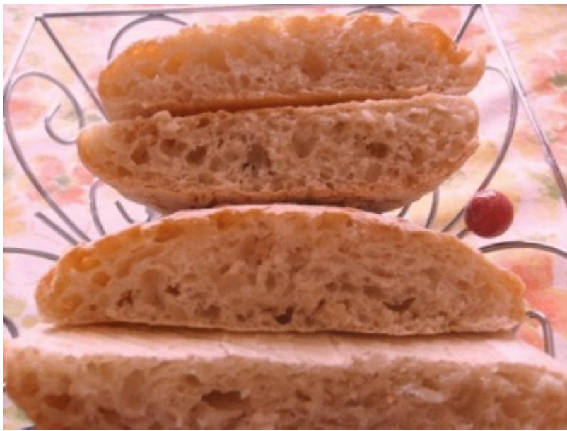
12 Un pò più da vicino...