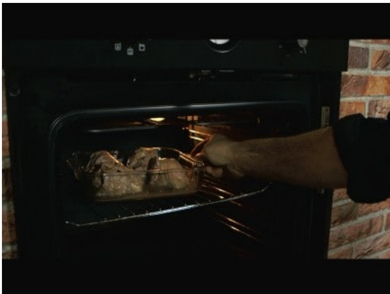
8 Bagnate la carne durante la cottura con la sua salsa.